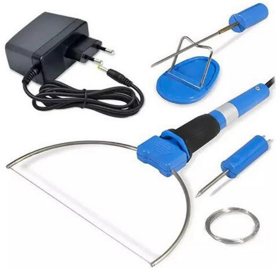
Instrumentas putplasčio pjovimui