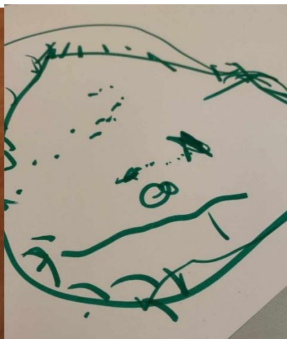
„Dėdė Abadas“ Glorija 2.6 m