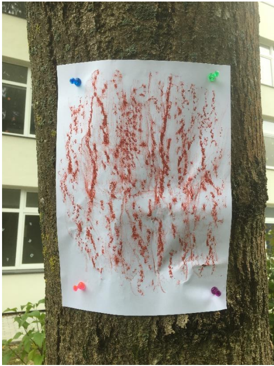
Paprastasis uosis / European ash