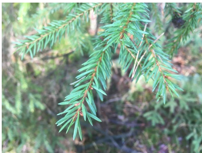
Paprastoji eglė / Norway spruce

Medžių lapų atspaudų ir vaisių bei sėklų nuotraukų pavyzdžiai (vaisių ir sėklų kompozicijas fotografuoti galima ant bet kokios spalvos fono):