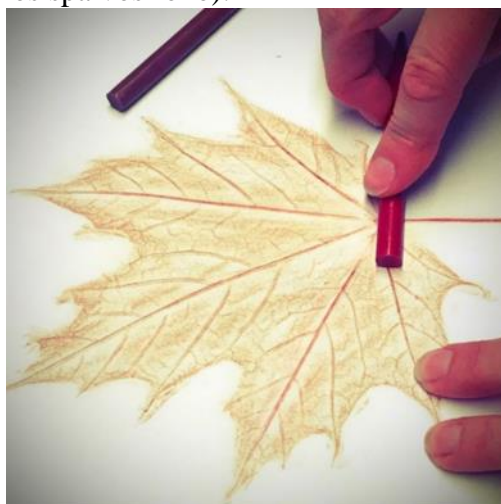
Paprastasis klevas / Norway maple

Medžių lapų atspaudų ir vaisių bei sėklų nuotraukų pavyzdžiai (vaisių ir sėklų kompozicijas fotografuoti galima ant bet kokios spalvos fono):