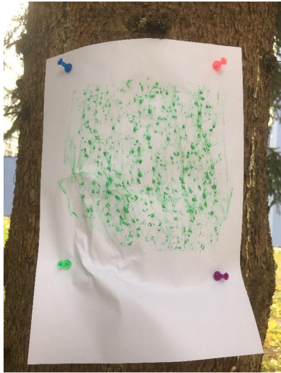
Paprastoji eglė / Norway spruce