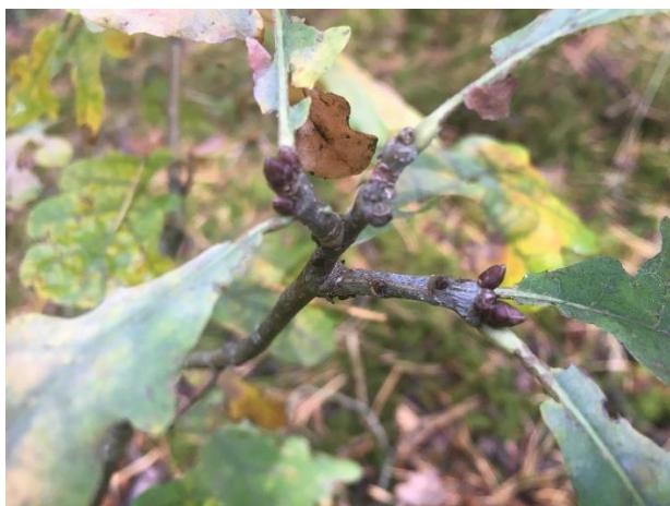
Paprastasis ąžuolas / Common oak

Medžių rūšies nustatymui tinka ir jaunos šakelės su lapų pumpurais: