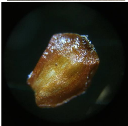
Baltalksnis / Grey alder