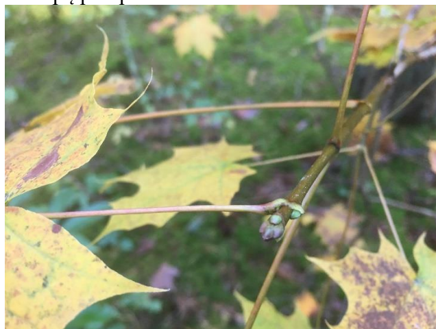
Paprastasis klevas / Norway maple