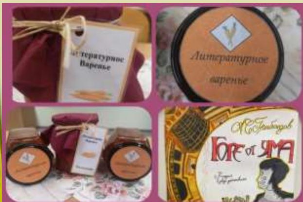
KAUNO "VYTURIO" GIMNAZIJA