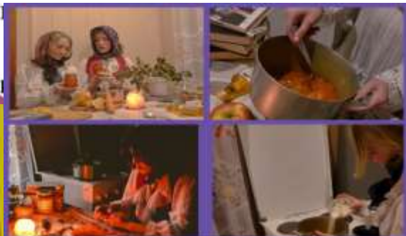
KAUNO VDU KLASIKINIO UGDYMO MOKYKLA

Kauno miesto bendrojo ugdymo mokyklų 5-10 klasių mokinių rusų kalbos raktinis projektas „Literatūrinė uogienė“