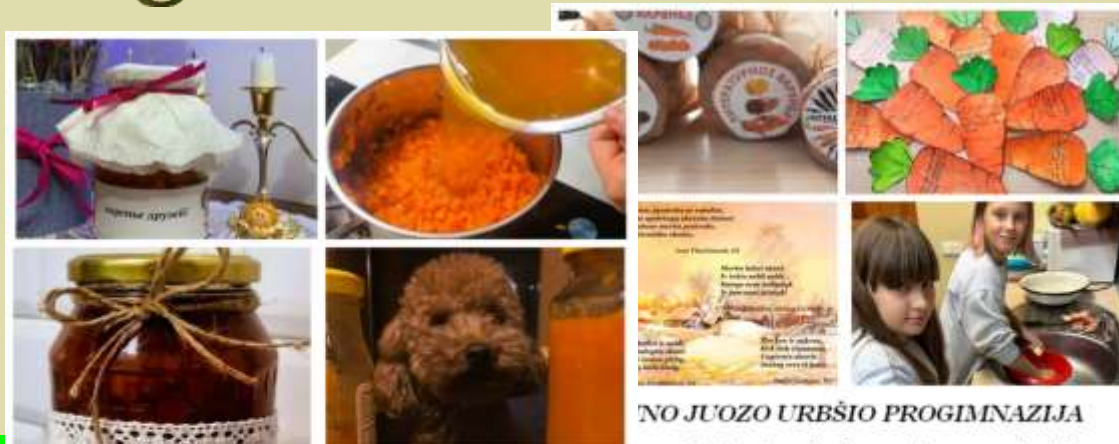
KAUNO VDU „RASOS“ GIMNAZIJA

Kauno miesto bendrojo ugdymo mokyklų 5-10 klasių mokinių rusų kalbos praktinis projektas „Literatūrinė uogienė“