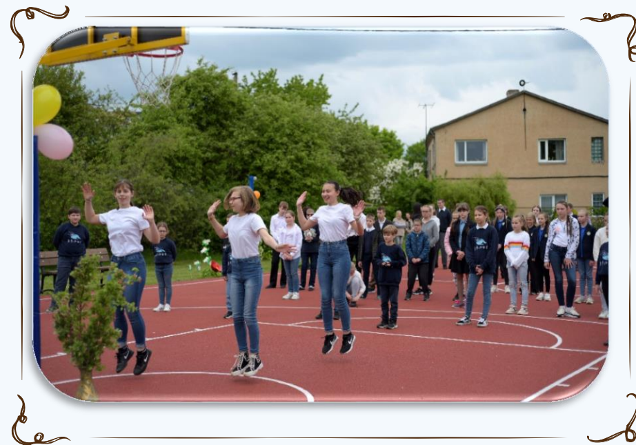
Šiuolaikinių šokių grupė "Daizy"